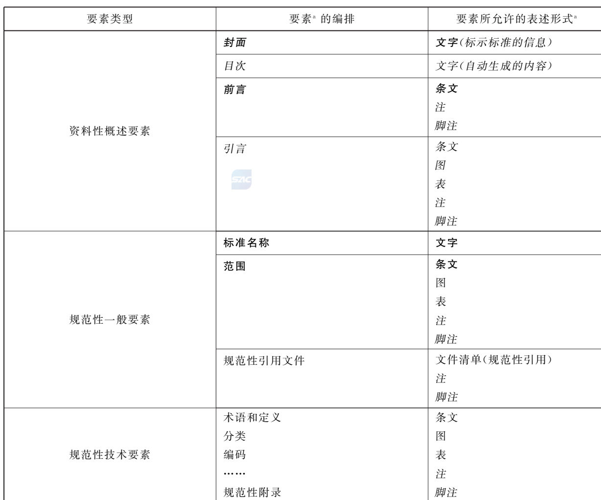
表 1 分类标准中要素的典型编排

分类标准中要素的典型编排以及每个要素所允许的表述形式见表 1。编写标准时,可根据分类对象和制定标准的目的选择表 1 中的有关要素。分类标准还可视情况包含表 1 之外的其他规范性技术要素。